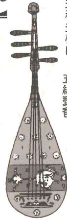
正倉院宝物 螺鈿紫檀 五絃琵琶

琵琶(びわ)は、木で作られた弦楽器で撥(はち)を用いて奏でる楽器です。西アジアの楽器ウードやバルバットが先祖様とされています。約1300年前奈良時代にシルクロードを経由して日本に伝来しました。